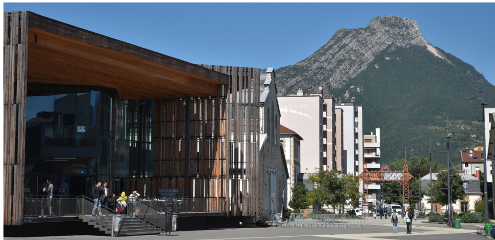
Salle de spectacle "La Belle Electrique"