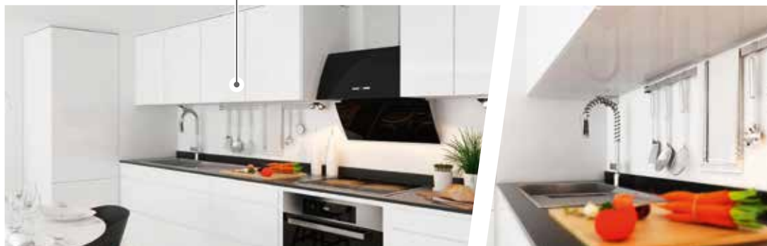
Carrelage gamme Premium Porcelanosa