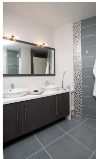
Carré Untzia • Bayonne • 2012