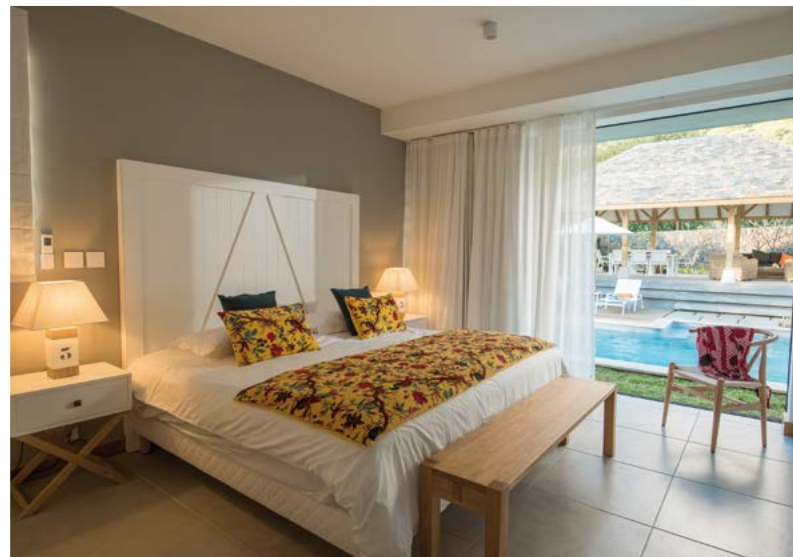
Marguery Villas • Île Maurice • 2017