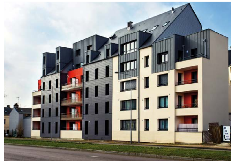
Atelier 99 • Rouen • 2014