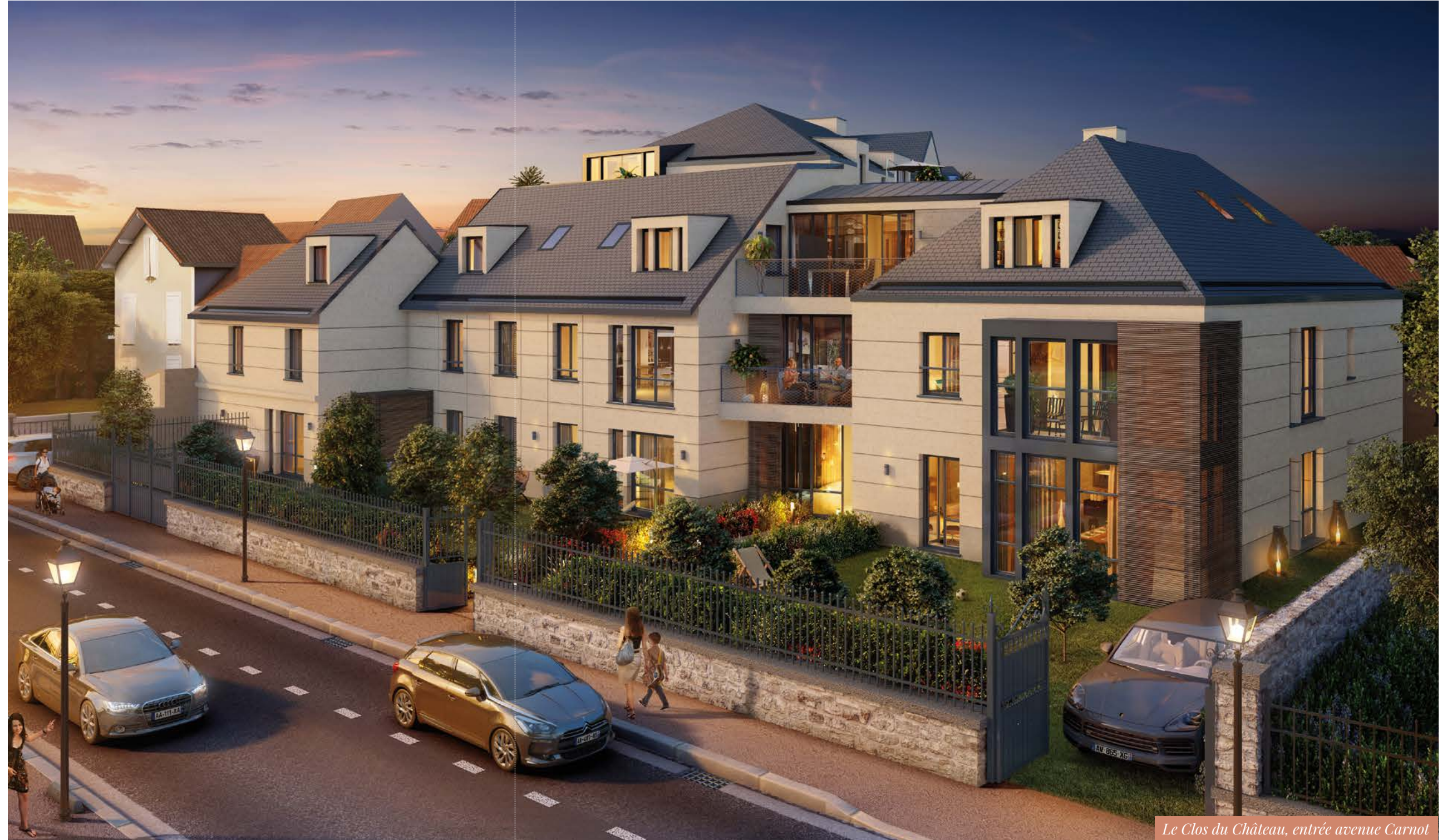
Le Clos du Château, entrée avenue Carnot

L'élégance racée du Clos du château s'inscrit dans la tradition la plus fine de l'architecture française. Pierre de taille, ardoise et autres matériaux anciens en ponctuent la façade tandis que les techniques les plus innovantes permettent à ce monument cossu d'allier confort moderne et classicisme. Lové entre ville et parc, il fait face au majestueux château de Maisons et à ses jardins, jouissant de toutes les commodités de l'avenue Longueil à seulement 600 mètres de là. Résidence d'exception à plusieurs titres, le Clos du château figure parmi les projets résidentiels les plus prestigieux de Maisons-Laffitte.