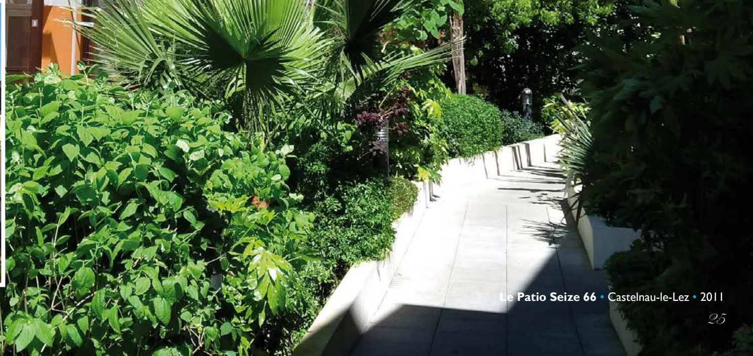
Le Patio Seize 66 • Castelnaud-le-Lez • 2011