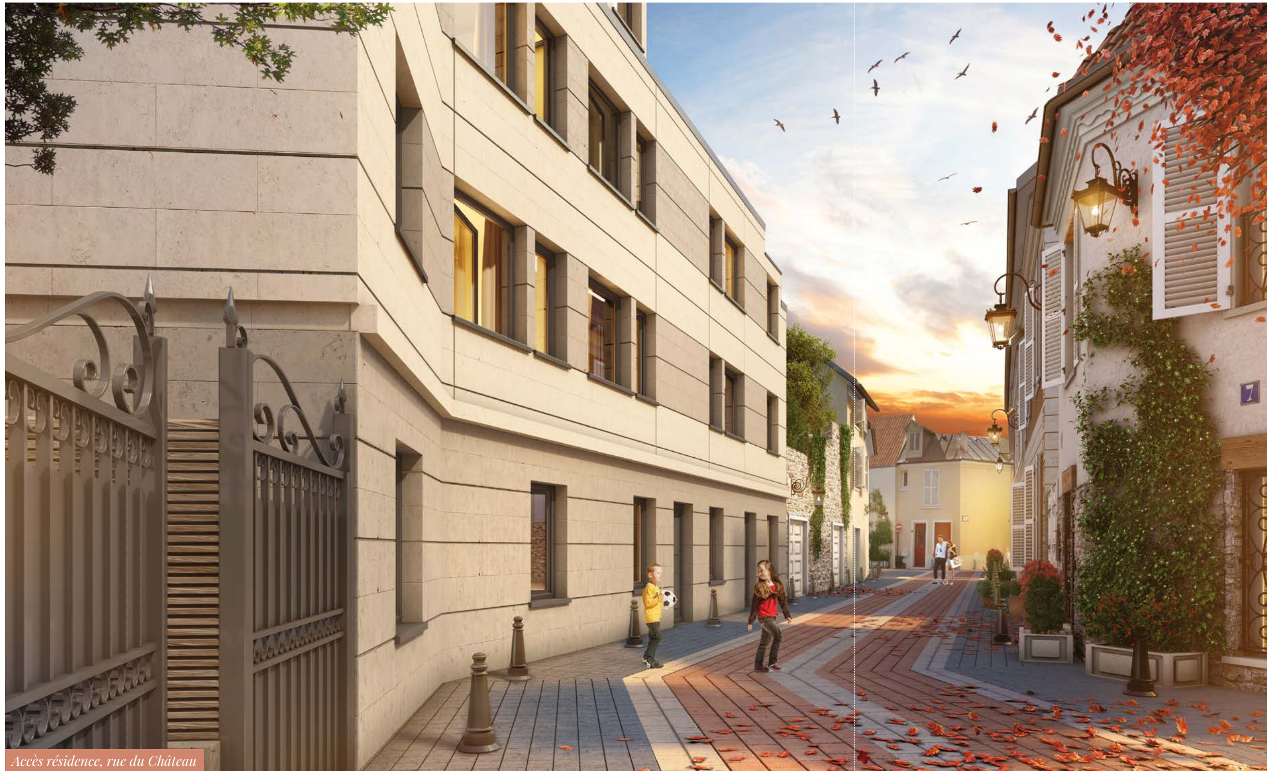
Accès résidence, rue du Château