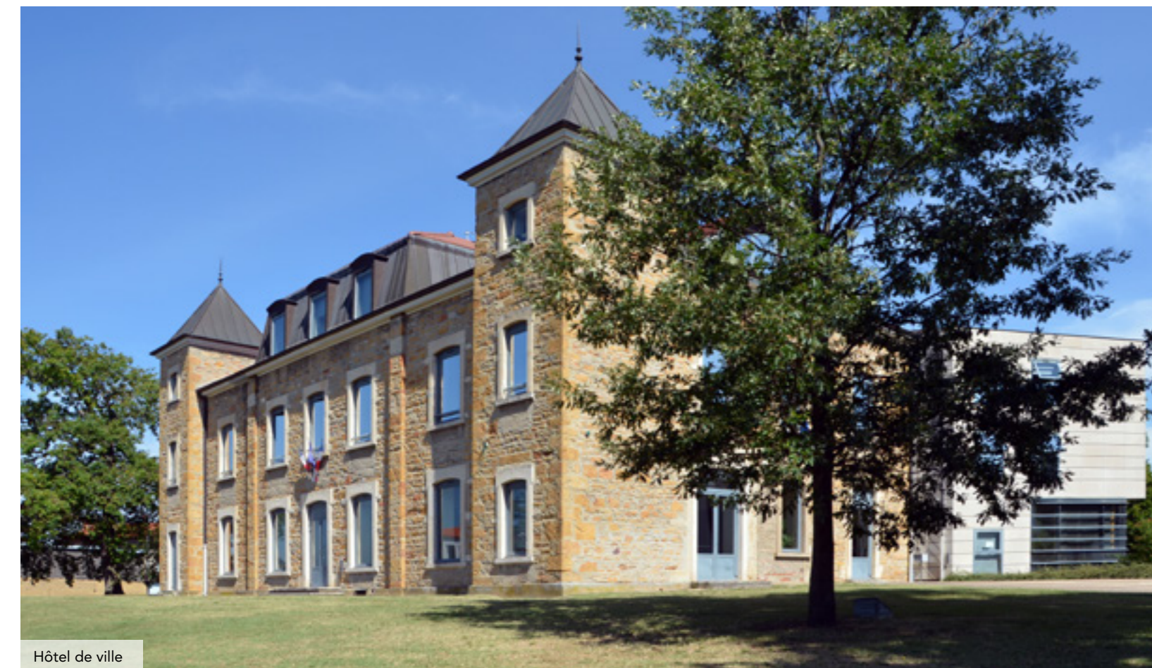
Hôtel de ville