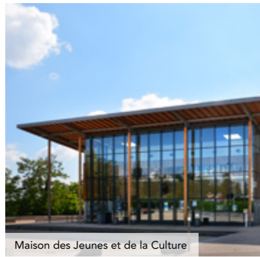
Maison des Jeunes et de la Culture