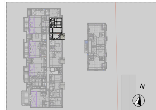
Tableau des surfaces