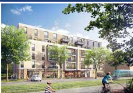
Le Clos Zadig à Châtenay-Malabry