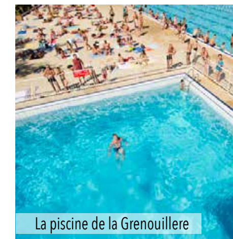
La piscine de la Grenouillère