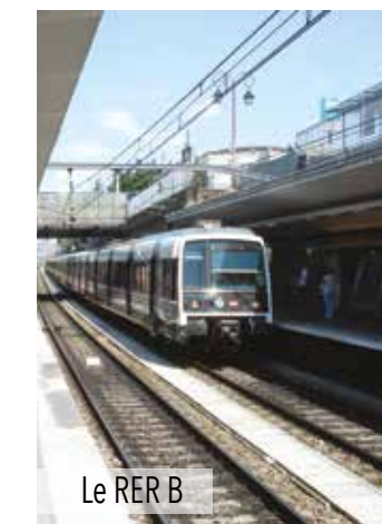
Le RER B