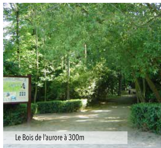
Le Bois de l'aurore à 300m