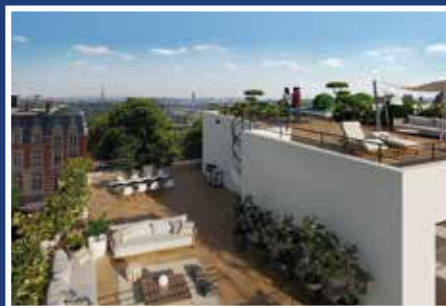
95 boulevard de la République à Saint-Cloud